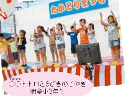
マルマル ○○トトロと6びきのこやぎ 明章小3年生