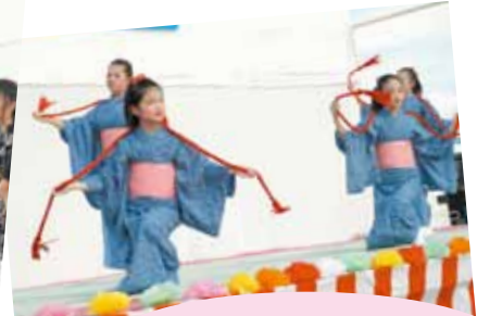
丸岡子ども舞踊「おどりゃんせ」 ~お月様・絵日傘・桜絵巻~