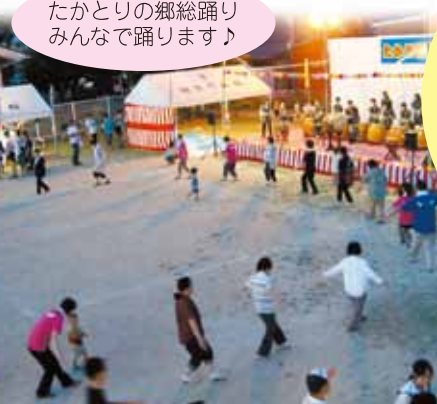
たかとりの郷総踊り みんなで踊ります♪

義援金 10,184円 たかとりまつり実行委員会から 福井新聞丸岡支局を通じて 東日本大震災の復興に 役立てられます。 ご協力ありがとうございました。