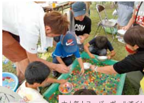
大人気! スーパーボールすくい