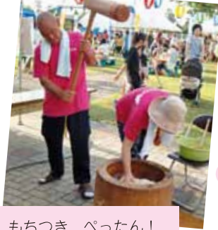
もちつき べったん!