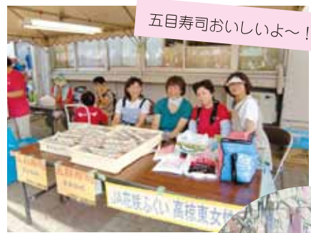
五目寿司おいしいよ〜!