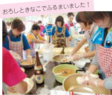
おろしときなごでふるまいました!