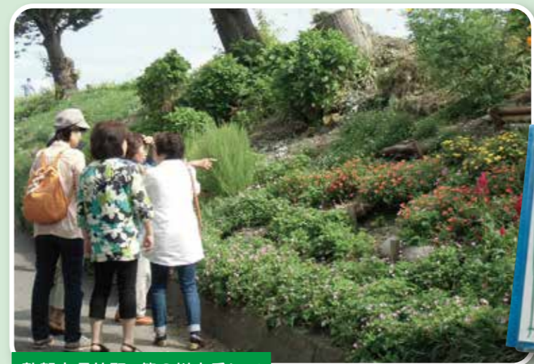
敦賀市呉竹町 笹の川土手にて